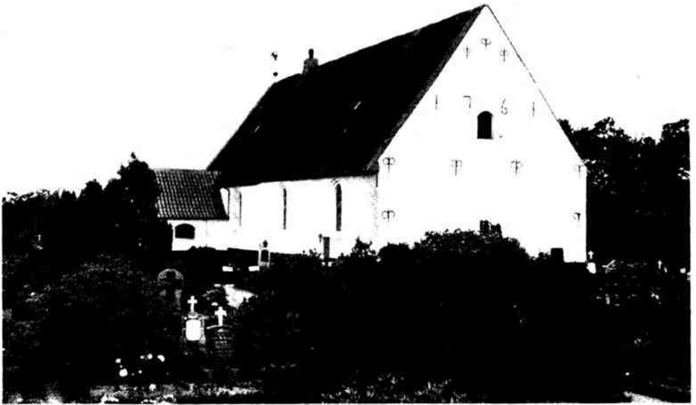
Fig. 1. Hjordkær. Ydre, set fra sydøst.