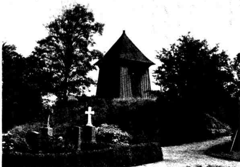
Fig. 3. Hjordkær. Klokkehus 1793 (p. 1818).